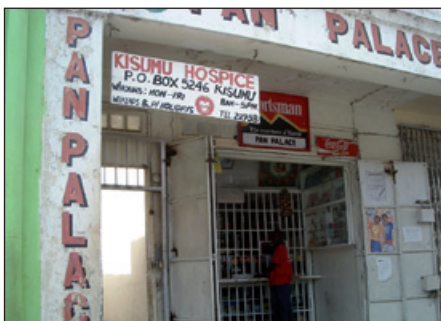
De entree van bestaande Hospice