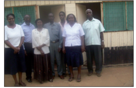
Team Kisumu Hospice