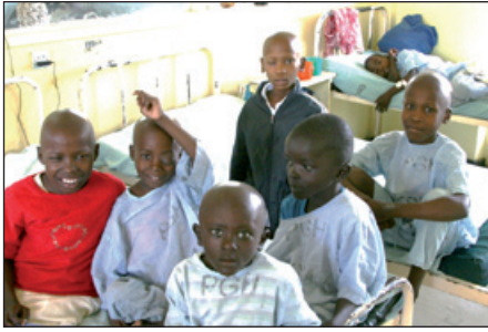
Kankerpatiëntjes in 'Ward 5'