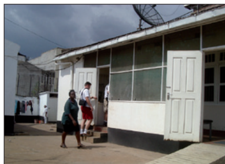
Administratie en apotheek bestaande Hospice