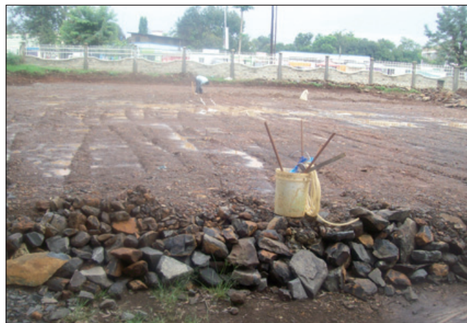
Bouwterrein nieuwe Hospice

Het gebouw krijgt een grootte van 625 m 2 en is zodanig ingedeeld dat er enige ruimtes kunnen worden verhuurd aan andere doktoren, zodat het gebouw “selfsupported” wordt.